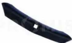
Наконечник оборотный 302001

Наконечник оборотный стойки 32x10 АКШ. Длина - 190 мм, ширина - 40 мм, толщина - 5 мм Рабочий орган культиваторов АКШ. Применяется для разрыхления почвы при подготовительных предпосевных работах. Изготавливается из различных марок легированной стали (65Г, 30МпВ5 и др.) с последующей термообработкой до твердости 48-52 HRC. Крепление - Болт М10х40-10,9 культиваторный МР-4 - 1 штука