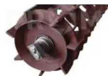
Каток малый АКШ-6,0 АПШ02.07.000