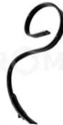
Стойка S-образная 32x10 КПЦ02.050

Стойка S-образная 32x10 мм в сборе. Ширина - 32 мм, толщина - 10 мм, высота - 540 мм.