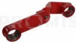
Кронштейн задний левый АКШ02.00.050

Кронштейн АКШ задний левый. Кронштейн крепления прикатывающих катков к раме культиваторов АКШ (Гидросельмаш Пинск, под подшипник 180210)