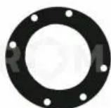
Кольцо резиновое АКШ02.00.009

Кольцо в крышку, АКШ. Резиновое уплотнительное кольцо круглого сечения наружного корпуса подшипника АКШ 02.00.005 культиваторов АКШ (Гидросельмаш Пинск, под подшипник 180210). Монтируется с крышкой АКШ 02.00.110