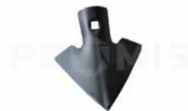
Наконечник стрельчатый 150 мм 302007

Препятствует попаданию пыли и влаги в корпус подшипника