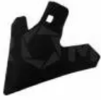
Наконечник стрельчатый 175 мм 302008

302008 Наконечник стрельчатый стойки 32x10/45x12 (175x4 mm) АКШ/КП. Длина - 123 мм, высота - 57 мм, ширина - 175 мм, толщина - 4 мм. Рабочий орган культиваторов АКШ. Применяется для разрыхления почвы и подрезания сорняков при подготовительных предпосевных работах. Изготавливается из различных марок легированной стали (65Г, 30MnB5 и др.) с последующей термообработкой до твердости 48-52 HRC. Крепление - Болт М10х40-10,9 культиваторный МР-4 - 1 штука