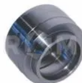
Корпус наружный АКШ02.00.005

Корпус (сфера) в сборе АКШ. Корпус внутренний крепления прикатывающего катка культиватора АКШ (Гидросельмаш Пинск, под подшипник 180210) к кронштейну в сборе. Состоит из корпуса подшипника (сферы) АКШ0200001 - 1 штука + манжеты 55x80-10 - 1 штука+ подшипник 180210 - 2 штуки + стопорное кольцо 90x2 DIN 472 - 1 штука