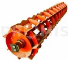
Каток малый АКШ-7,2 АКШ12.22.000

Каток АКШ-7,2 малый. Длина с цапфами - 1650 мм, диаметр - 300 мм. Изготовлен из низколегированной стали. Толщина планки 8 мм. Применяется в почвообрабатывающих агрегатах АКШ (Гидросельмаш Пинск, под подшипник 180210). Предназначены для крошения, прикатывания, выравнивания почвы после подрезания и рыхления ее стойками с наконечниками. Комплект 8 штук