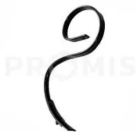
Стойка S-образная 32x10 КПЦ02.050

КПЦ02.050/300001 Стойка S-образная 32x10 мм в сборе. Ширина - 32 мм, толщина - 10 мм, высота - 540 мм. Применяется для разрыхления почвы в комбинации с прикатывающими катками в культиваторах АКШ.