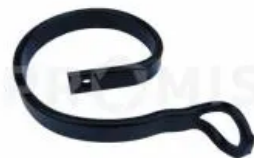
Подпружинник стойки 300054

Наконечник стрельчатый стойки 32x10 (105x4 мм) АКШ. Длина - 123 мм, высота - 57 мм, ширина - 105 мм, толщина - 4 мм. Рабочий орган культиваторов АКШ. Применяется для разрыхления почвы и подрезания сорняков при подготовительных предпосевных работах. Изготавливается из различных марок легированной стали (65Г, 30MnB5 и др.) с последующей термообработкой до твердости 48-52 HRC. Крепление - Болт М10х40-10,9 культиваторный МР-4 - 1 штука