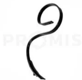
Стойка S-образная 32x10 300001

Подпружинник стойки 32x10 АКШ. Усилитель стойки S-образной 32x10 культиваторов АКШ