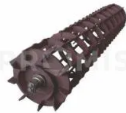
Каток большой АКШ-6,0 АПШ02.08.000

Зажим стойки 32x10 (50x6 мм) АКШ. Кронштейн крепления стойки S-образной к балке культиваторов АКШ. Для балки сечением 50x12 мм