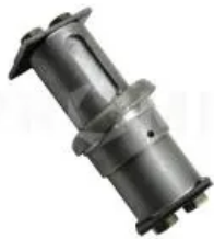
Цапфа в сборе АКШ12.20.001СБ

Стойка S-образная 32x10 мм в сборе. Ширина - 32 мм, толщина - 10 мм, высота - 540 мм.