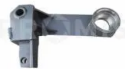
Кронштейн передний левый АКШ02.01.000

Кронштейн АКШ задний правый. Кронштейн крепления прикатывающих катков к раме культиваторов АКШ (Гидросельмаш Пинск, под подшипник 180210)