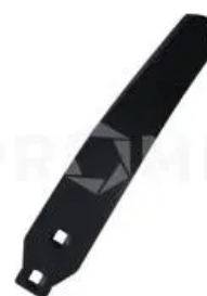
Отвал левый 34060858