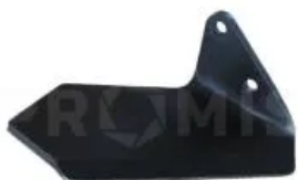
Лапа односторонняя правая 34060857

Лапа односторонняя Horsch левая. Длина - 250 мм, толщина - 10 мм, ширина - 105 мм. Крыло подрезное левое. Рабочий орган культиваторов Horsch. Применяется для разрыхления почвы и подрезки стерни. Изготавливается из различных марок легированной стали (65г, 30MnB5 и других) с последующей термообработкой до твердости 48-52 HRC. Крепление - 2 болта M12x60-12.9 DIN 931 (артикул 00360037). Межцентровое расстояние крепежных отверстий 60 мм