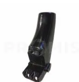
Корпус пружины 34063503

Комплект уплотнений 100-50, Horsch. Комплект уплотнений гидроцилиндра DZ100x50x205 (артикул 00130379)