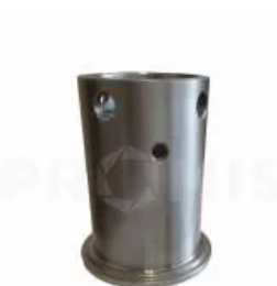
Корпус ступицы 34633701

Корпус пружины, Horsch. Один из элементов механизма крепления стойки культиваторов Horsch к раме