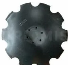
Диск зубчатый 00311081

Вал фланцевый, Horsch. Диаметр наружный - 195 мм, диаметр вала - 50 мм, длина - 130 мм, межцентровой диаметр - 150 мм, количество отверстий - 6 штук. Фланцевый вал ступицы крепления выравнивающего диска культиваторов Horsch. Для обеспечения максимально возможной долговечности корпус ступицы изготовлен из заготовки, полученной методом пластической деформации металла (штамповкой). Требуемые геометрические размеры обеспечиваются механической обработкой на высокоточном оборудовании