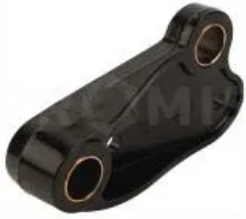
Пластина соединительная левая 34068800

Пластина соединительная левая, Horsch. Опора амортизатора стойки культиватора Horsch. Один из элементов механизма крепления стойки культиваторов к раме