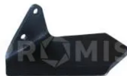
Лапа односторонняя левая 34060856

Крышка прижимная, Horsch. Прижимная монтажная пластина диска подрезного к ступицам (артикул 34633700/34633600) культиваторов Horsch