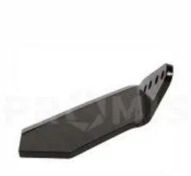
Крыло левое 00311274

Корпус ступицы, Horsch. Корпус задней ступицы (артикул 34634700) в сборе крепления выравнивающего диска культиваторов Horsch