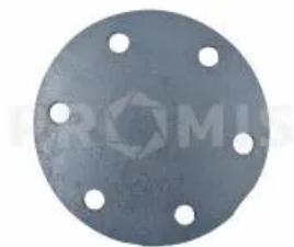
Крышка прижимная 34631501

Крышка прижимная, Horsch. Прижимная монтажная пластина диска подрезного к ступицам (артикул 34633700/34633600) культиваторов Horsch