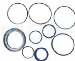
Комплект уплотнений 00130393

Комплект уплотнений, Horsch. Комплект уплотнений гидроцилиндра DZ100x40x510 (артикул 00130229)