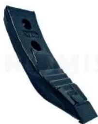
Наконечник усиленный 00311069

Наконечник культиватора (120 мм), Horsch. Толщина - 12 мм, длина - 295 мм, ширина - 120 мм.