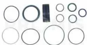
Комплект уплотнений 00130392

Комплект уплотнений, Horsch. Комплект уплотнений гидроцилиндра DZ100x40x510 (артикул 00130229)