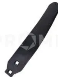
Отвал правый 34060859

Отвал (80 мм) левый, Horsch. Длина - 420 мм, толщина - 8 мм, ширина - 80 мм. Защита стойки культиваторов Horsch правая с дополнительным отвалом. Применяется для рыхления при безотвальной обработке почвы. Предохраняет стойку от преждевременного износа и способствует разбиванию крупных комков грунта. Изготавливается из различных марок легированной стали с последующей термообработкой и закалкой до значений HRC 50(+2). Крепление - болт M12x85-12.9 DIN 608 (артикул 00310808) - 1 штука + болт M12x85-12.9 DIN 608 (артикул 00310726) - 1 штука. Межцентровое расстояние отверстий 57 мм