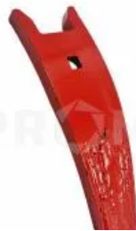
Долото наплавленное 00310915

Диск культиватора D=684x7 мм (6 отверстий), Horsch. Диаметр наружный - 684 мм, толщина - 7 мм, межцентровой диаметр - 150 мм. Выравнивающий диск культиваторов Horsch. Применяется для предварительного рыхления почвы перед обработкой ее стойками культиватора. Диски изготавливаются из легированной стали (65Г, 30MnB5) с последующей термообработкой и закалкой до значений HRC 50(+2). Крепление - болт M16x35-10,9 DIN 6921 с буртиком (артикул 00360217) - 6 штук