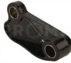
Пластина соединительная правая 34068900

Пластина соединительная левая, Horsch. Опора амортизатора стойки культиватора Horsch. Один из элементов механизма крепления стойки культиваторов к раме