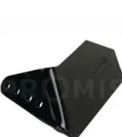
Крыло правое 00311275

Крыло наплавленное левое, Horsch. Длина - 172,5 мм, толщина - 10 мм, ширина - 105 мм. Крыло подрезное левое. Рабочий орган культиваторов Horsch. Применяется для разрыхления почвы и подрезки стерни. Изготавливается из различных марок легированной стали (65г, 30MnB5 и других) с последующей термообработкой до твердости 48-52 HRC. Крепление - 2 болта M12x60-12.9 DIN 931 (артикул 00360037). Межцентровое расстояние крепежных отверстий 60 мм. Для увеличения срока службы рабочие поверхности упрочнены пластинами из карбида вольфрама