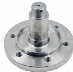
Вал фланцевый 34630405

Амортизатор, Horsch. Один из элементов механизма крепления стойки культиваторов Horsch к раме. Выполняет амортизационную и защитную функцию от повреждения стойки при столкновении с препятствием