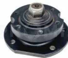
Модуль срезной 0009333230

Крышка фланца модуля приводного, Claas. Составная часть модуля режущего бруса косилки Claas Disco 3050/8550