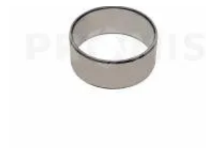
Кольцо внутреннее 0002153280