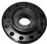
Крышка фланца модуля приводного 0009354740

Крышка фланца модуля приводного, Claas. Составная часть модуля режущего бруса косилки Claas Disco 3050/8550