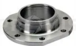
Фланец модуля 0009354730

Препятствует разбросу срезанной травы и предотвращает вылет твердых предметов, попавших под ножи косилки в процессе ее работы