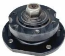
Модуль срезной 0009333231

Модуль срезной, Claas. Модуль вращающийся, узел крепления барабана (тарелки) режущего бруса косилки Claas Disco 3050/8550