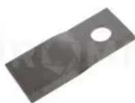
Нож косилки левый 0009520430

Накладка фрикционная 151x91x3, Claas. Составная часть муфты фрикционной приводного карданного вала режущего бруса косилки Claas Disco 3050/8550