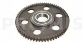
Шестерня бруса 0009354770