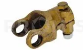
Вилка наружная 0001380540

Вилка желобчатая RG2400-2A, Claas. Внутренняя вилка приводного карданного вала косилки Claas Disco 3050/8550. Монтируется на профильную трубу. Тип - "лимон". Под крестовину 32x76 мм