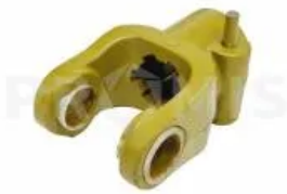
Вилка насадная 0009416570

Вилка наружная GR.2MITSCHIEBESTIFT, Claas. Наружная вилка приводного карданного вала косилки Claas Disco 3050/8550