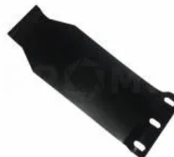
Башмак опорный 0009389660

Башмак (полоз), Claas. Башмак опорный режущего бруса косилки Claas Disco 3050/8550. Предохраняет брус режущий от абразивного износа и от механических повреждений