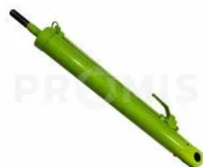
Гидроцилиндр подъема секции 0009233371

Втулка срезного модуля, Claas. Установочная втулка модуля режущего бруса косилки TC 35x62x7 3050/8550