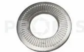
Шайба контактная 0002121910

Фланец (корпус) модуля, Claas. Корпус подшипника модуля режущего бруса косилки Claas Disco 3050/8550