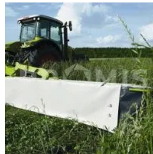
Тент косилки 0009349692

Препятствует разбросу срезанной травы и предотвращает вылет твердых предметов, попавших под ножи косилки в процессе ее работы