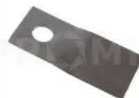
Нож косилки правый 0009520420