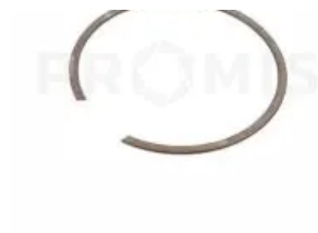
Кольцо стопорное 1,8x4 DIN7993