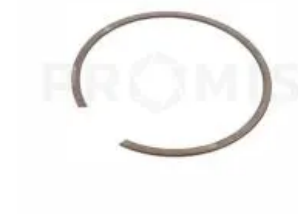
Кольцо стопорное 1,8x4 DIN7993