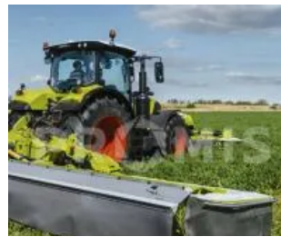
Тент косилки 0009349552

Тент косилки (Disco 2750), Claas. Зажитный кожух бруса режущего косилки Claas Disco 2750. Препятствует разбросу срезанной травы и предотвращает вылет твердых предметов, попавших под ножи косилки в процессе ее работы