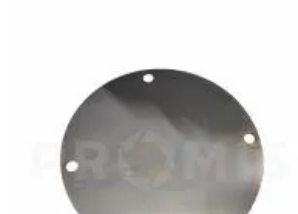
Крышка барабана 0009379261

Крышка барабана, Claas. Крышка косилочного барабана режущего бруса косилки Claas Disco 3050/8550