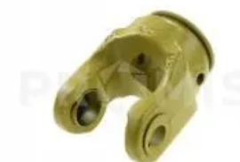
Вилка желобчатая 0009416560