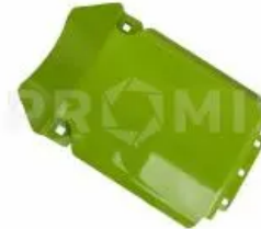
Башмак (комплект 2 шт) 0003067680

Барaban, Claas. Вращающийся ротор бруса режущего косилки Claas Disco 3050/8550