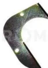
Полукольцо приводного барабана 0009384241