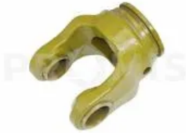
Вилка желобчатая 0009416600

Вилка желобчатая RG2400-2A, Claas. Внутренняя вилка приводного карданного вала косилки Claas Disco 3050/8550. Монтируется на профильную трубу. Тип - "лимон". Под крестовину 32x76 мм