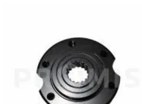
Крышка фланца модуля под срез 0009356660

Крышка барабана, Claas. Крышка косилочного барабана режущего бруса косилки Claas Disco 3050/8550