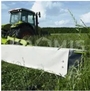
Тент косилки 0009349691

Тент косилки (Disco 2750), Claas. Зажитный кожух бруса режущего косилки Claas Disco 2750. Препятствует разбросу срезанной травы и предотвращает вылет твердых предметов, попавших под ножи косилки в процессе ее работы