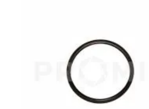
Кольцо уплотнительное 0009396870