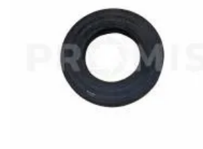
Кольцо уплотнительное 0002118040

Кольцо (манжета) уплотнительное вала редуктора TC 35x62x7, Claas