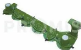
Брус косилки 200311410

Барабан косилочный, Krone. Длина - 356 мм. Вращающийся ротор высокий бруса режущего косилки Krone (КДЛ/КДН)