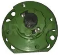
Модуль срезной (без смещения) с правой резьбой 200311253

Модуль срезной (без смещения, правая резьба), Krone. Модуль крепления диска косилочного к брусу режущему косилки Krone