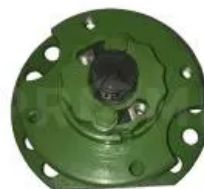
Модуль срезной (без смещения) с правой резьбой 200311251

Вал карданный с муфтой (от редуктора к брусу), Krone. Приводной карданный вал бруса режущего косилки Krone EasyCut 280 (КДЛ/КДН). Передает вращение от центрального редуктора к приводному редуктору бруса режущего косилки. Оснащен фрикционной муфтой. Длина в сложенном состоянии - 760 мм, количество шлицов на присоединительных вилках Z = 6/6