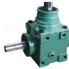
Редуктор главный 002530703

Пластина (ножедержатель) L=377 mm, Krone. Пластина крепления ножа к низкому барабану бруса режущего осилки Krone