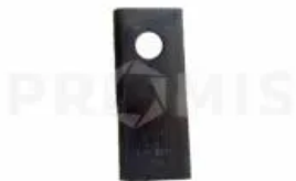
Нож правый 001398890

Нож косилки (112x50x4 mm) Krone левый. Длина - 112 мм, ширина - 50 мм, толщина - 4 мм, диаметр крепежного отверстия - 19 мм. Основной рабочий орган косилки Krone. Предназначен для скашивания травы. Изготавливается из различных марок углеродистой легированной стали (СТ45, СТ65Г и др.) с последующей термообработкой