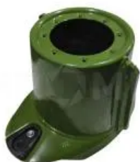
Башмак косилочный 200310630

Барабан косилочный, Krone. Длина - 356 мм. Вращающийся ротор высокий бруса режущего косилки Krone (КДЛ/КДН)