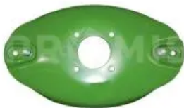
Тарелка с держателем 200310621

Тарелка косилки с держателем, Krone. Длина - 356 мм. Косилочный диск крепления ножа бруса режущего косилки Krone EasyCut (КДЛ/КДН)