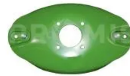
Тарелка с держателем 200310620

Тарелка косилки с держателем, Krone. Длина - 356 мм. Косилочный диск крепления ножа бруса режущего косилки Krone EasyCut (КДЛ/КДН)