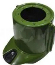
Башмак косилочный 002535321

Башмак (полоз) косилки, Krone. Башмак опорный режущего бруса косилки Krone (КДЛ/КДН). Предохраняет брус режущий от абразивного износа и от механических повреждений