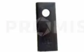
Нож правый 001398893

Нож косилки (112x50x4 mm) Krone левый. Длина - 112 мм, ширина - 50 мм, толщина - 4 мм, диаметр крепежного отверстия - 19 мм. Основной рабочий орган косилки Krone. Предназначен для скашивания травы. Изготавливается из различных марок углеродистой легированной стали (СТ45, СТ65Г и др.) с последующей термообработкой