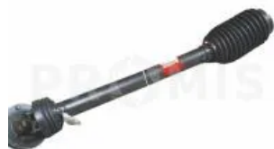
Вал карданный с муфтой 009560912

Брус косилки в сборе, Krone. Длина - 3,14 м. Брус режущий в сборе косилки Krone EasyCut 320 (КДЛ/КДН)