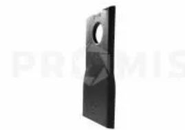
Нож левый 001398884

Нож косилки (112x50x4 mm) Krone левый. Длина - 112 мм, ширина - 50 мм, толщина - 4 мм, диаметр крепежного отверстия - 19 мм. Основной рабочий орган косилки Krone. Предназначен для скашивания травы. Изготавливается из различных марок углеродистой легированной стали (СТ45, СТ65Г и др.) с последующей термообработкой