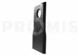
Нож левый 001398883

Нож косилки (112x50x4 mm) Krone левый. Длина - 112 мм, ширина - 50 мм, толщина - 4 мм, диаметр крепежного отверстия - 19 мм. Основной рабочий орган косилки Krone. Предназначен для скашивания травы. Изготавливается из различных марок углеродистой легированной стали (СТ45, СТ65Г и др.) с последующей термообработкой