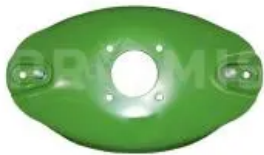
Тарелка с держателем 002535312

Редуктор главный (Z=22/16, 540 оборотов в минуту), Krone. Центральный редуктор бруса режущего косилки Krone EasyCut (КДЛ/КДН). Передает вращение от главного карданного вала (от вала отбора мощности) на вспомогательный карданный вал (от редуктора к брусу)