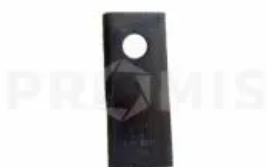
Нож правый 001398894

Нож косилки (112x50x4 mm) Krone правый. Длина - 112 мм, ширина - 50 мм, толщина - 4 мм. Основной рабочий орган косилки Krone. Предназначен для скашивания травы. Изготавливается из различных марок углеродистой легированной стали (СТ45, СТ65Г и др.) с последующей термообработкой