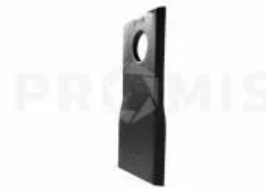
Нож левый 001398880

Модуль срезной (без смещения, правая резьба), Krone. Модуль крепления диска косилочного к брусу режущему косилки Krone